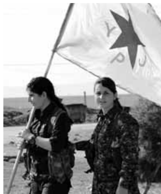
Notre solidarité va aux forces qui, à leur lutte contre le colonialisme, associent un projet émancipateur. Ici, des miliciennes kurdes des YPJ, en Syrie, en 2012.

Un soutien critique aux luttes de libération anticoloniale