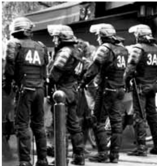
MARIE-AU PALAIOU/UCI GRAND-PARIS SUD

L'anti-étatisme libertaire se distingue également nettement de