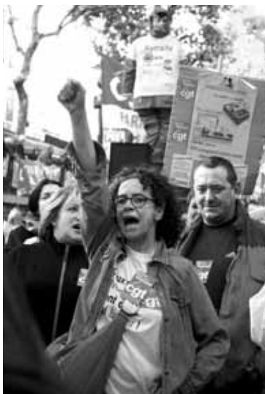
MARIE-AU PALACIO/UCL GRAND-PARIS SUD

Malgré des conditions et vécus communs, le prolétariat n'est pas