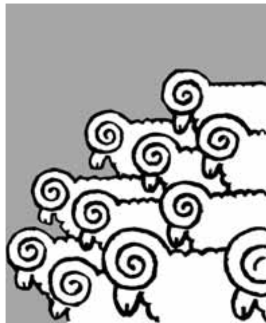
Il faut remettre en cause les normes genrées, sociales, hiérarchiques imposées tout au long de la vie au nom d'une prétendue « nature ».

La société capitaliste est une société éminemment validiste. Le validisme est une oppression qui touche les personnes en situation de handicap (physique ou psychique, visible ou invisible). Le capitalisme encourage et soutient des structures validistes, dans la mesure où il valide les individus en fonction des capacités qui les rendent productifs ou exploitables dans la sphère du salariat. Les personnes qui ne correspondent pas à ces normes sont proprement invalidées, et ainsi exclues, marginalisées ou minorisées. Le validisme est également cristallisé dans les infrastructures urbaines, qui ne sont, le plus souvent, adaptées qu'à un individu valide type (un individu qui n'est pas en fauteuil, par